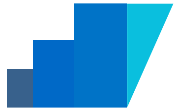
Terme di Sirmione