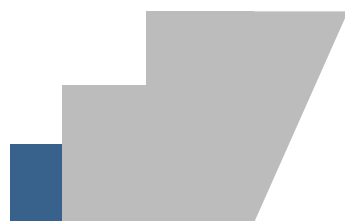
Grand Hotel Fonte Boiola