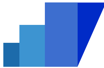
Terme di Sirmione