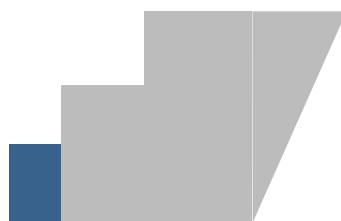
Grand Hotel Sirmione