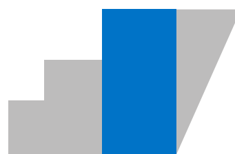
Acqua di Sirmione