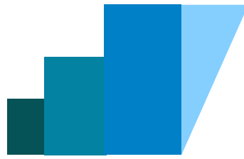
Terme di Sirmione