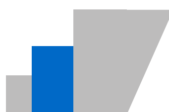
Tesori di Acquaria